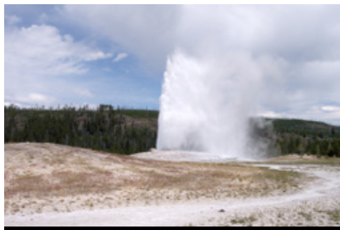
photo: Parco Nazionale di Yellowstone, MT Old Faithful—Parco Nazionale di Yellowstone, MT