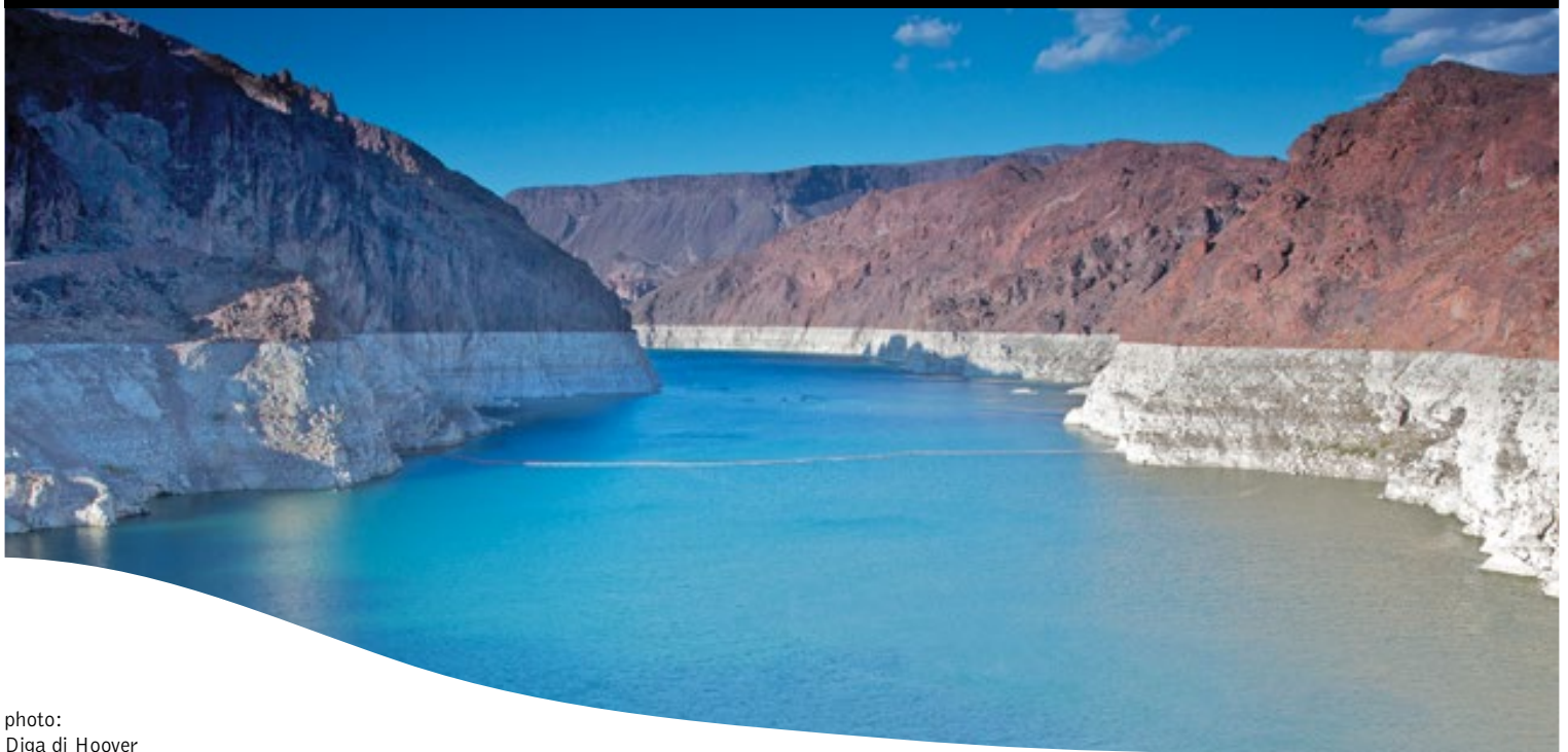
photo: Diga di Hoover

14 giorni / 13 notti. Tutto l'anno. Inizio/Fine tour: Los Angeles