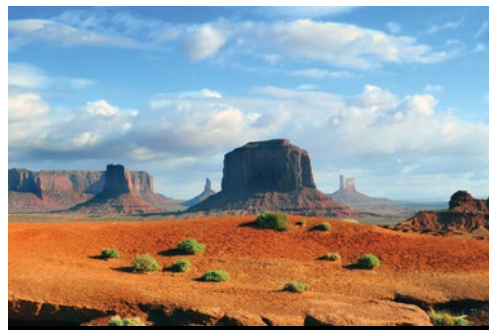
photo: Los Angeles—Panorama notturno Parco Nazionale di Monument Valley