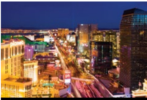
photo: Parco Nazionale del Grand Canyon—Cascata Las Vegas—le mille luci dei casinò

di Mammoth Lakes. Questa deliziosa cittadina di montagna è una destinazione amata sia d'estate che d'inverno e offre stupendi panorami delle montagne che la circondano (durante il periodo invernale quando il Passo del Tioga è chiuso il pernottamento sarà previsto a Bakersfield / Fresno).