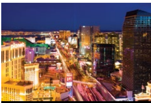
photo: Parco Nazionale del Grand Canyon—Cascata Las Vegas—le mille luci dei casinò

che d' inverno e offre stupendi panorami delle montagne che la circondano (durante il periodo invernale quando il Passo del Tioga è chiuso il pernottamento sarà previsto a Bakersfield / Fresno).