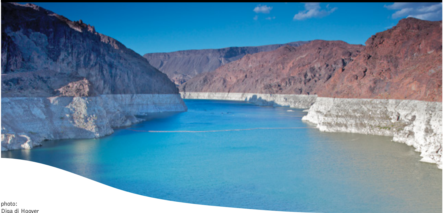
photo: Diga di Hoover

11 giorni / 10 notti. Da marzo a settembre. Inizio/Fine tour: Los Angeles/San Francisco