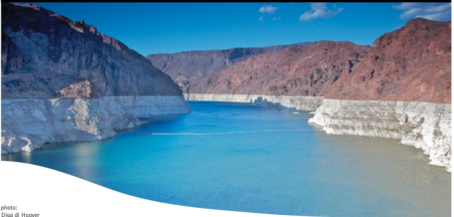
photo: Diga di Hoover

14 giorni / 13 notti. Tutto l'anno. Inizio/Fine tour: Los Angeles