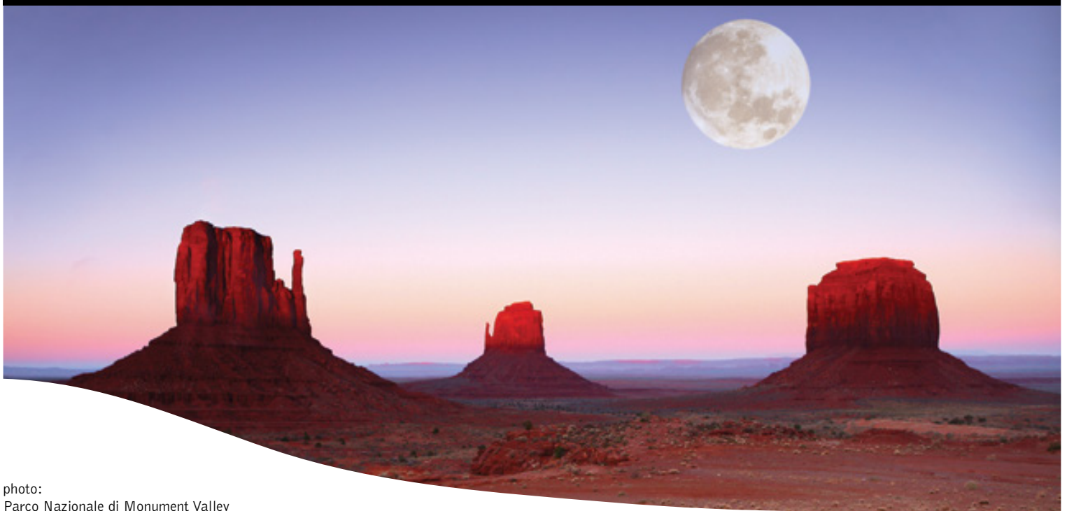
photo: Parco Nazionale di Monument Valley

9 giorni / 8 notti. Da giugno a ottobre. Inizio/Fine tour: Los Angeles