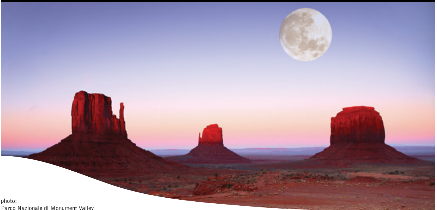
photo: Parco Nazionale di Monument Valley

9 giorni / 8 notti. Da maggio a settembre. Inizio/Fine tour: Los Angeles