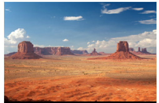
photo: Santa Monica—Panorama al tramonto Parco Nazionale della Monument Valley—Panorama