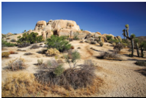
photo: Parco Nazionale del Bryce Canyon—Panorama California—Parco Nazionale di Joshua Tree