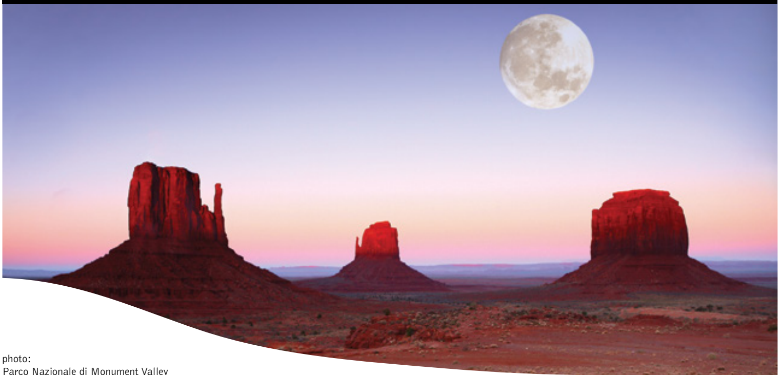
photo: Parco Nazionale di Monument Valley

9 giorni / 8 notti. Da giugno ad agosto. Inizio/Fine tour: Los Angeles