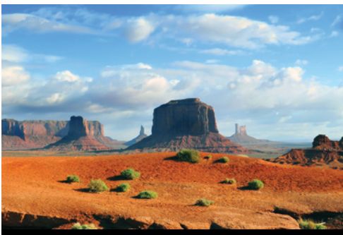
Panorama da Encanto park Parco Nazionale di Monument Valley

Bryce Canyon, dove i vostri occhi saranno stregati da un mondo fatto di pinnacoli multicolore, gli Hoodoos. La sera, tempo permettendo, osservate lo spettacolare cielo notturno e di respirate a pieno l'aroma proveniente dai falò che bruciano legno di pino.