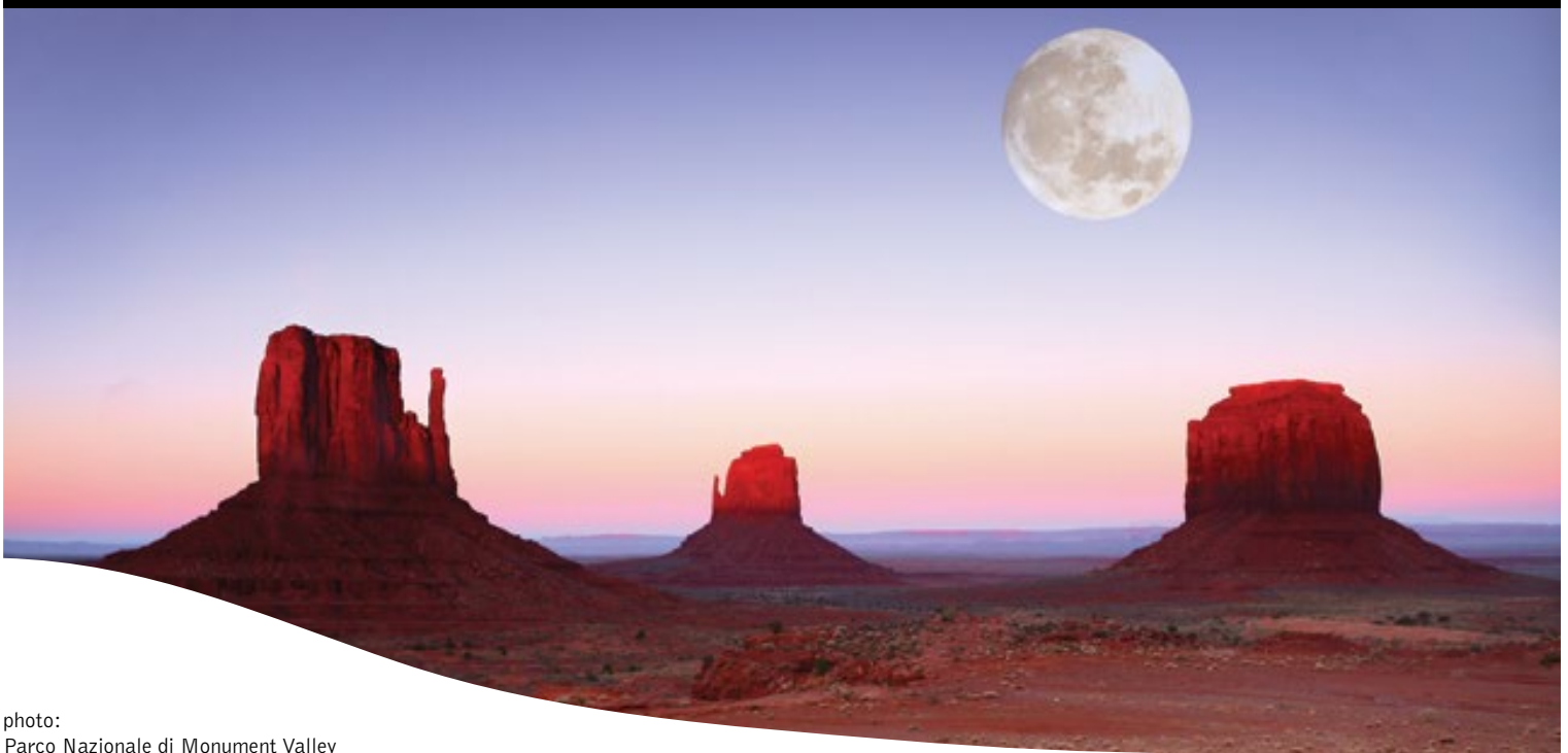
photo: Parco Nazionale di Monument Valley

9 giorni / 8 notti. Da luglio ad agosto. Inizio/Fine tour: Los Angeles