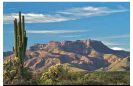
photo: Las Vegas—Panorama Un cactus Saguaro nel deserto dell'Arizona