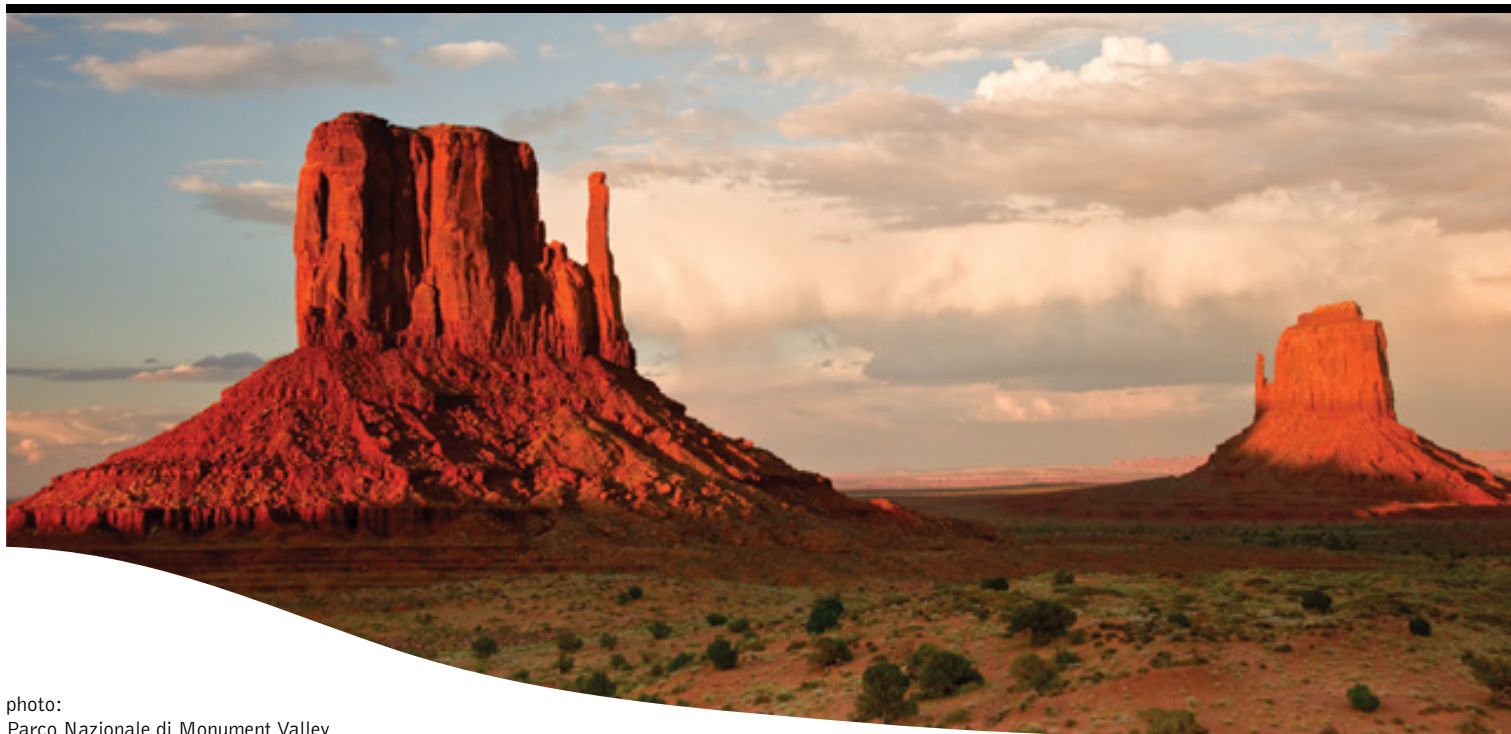
photo: Parco Nazionale di Monument Valley

12 giorni / 11 notti. Da giugno a settembre. Inizio/Fine tour: Los Angeles/Las Vegas