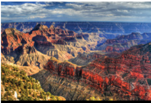
photo: Parco Nazionale del Bryce Canyon— Panorama Parco Nazionale del Grand Canyon— Panorama

del Mojave per poi entrare nello Stato del Nevada. Durante il pomeriggio è previsto l'arrivo a Las Vegas, la città dell'intrattenimento e del gioco d'azzardo.