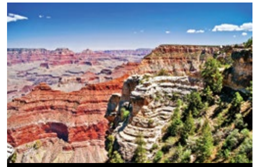
photo: Parco Nazionale del Grand Canyon—Panorama San Francisco—Panorama