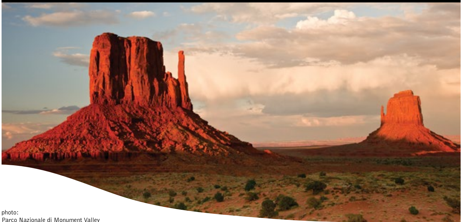
photo: Parco Nazionale di Monument Valley

13 giorni / 12 notti. Da maggio a settembre. Inizio/Fine tour: Los Angeles