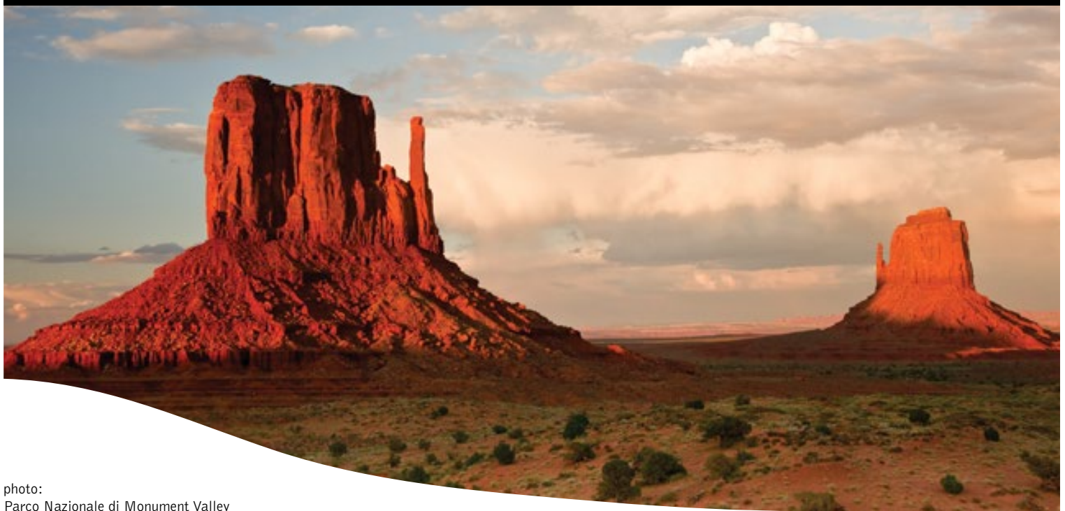
photo: Parco Nazionale di Monument Valley

13 giorni / 2 notti. Da giugno a settembre. Inizio/Fine tour: Los Angeles