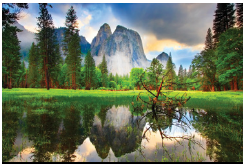
photo: Parco Nazionale dello Yosemite

Prima colazione (con supplemento). Dedicate la mattinata alla scoperta di una delle più belle città d'America. Da non perdere Union Square, Chinatown, il Golden Gate Park e Fisherman's Wharf, con la vista sulla famigerata isola di Alcatraz, dall'altra parte della baia. Pomeriggio libero con possibilità di prendere parte all'escursione facoltativa alla scoperta del caratteristico villaggio di Sausalito.