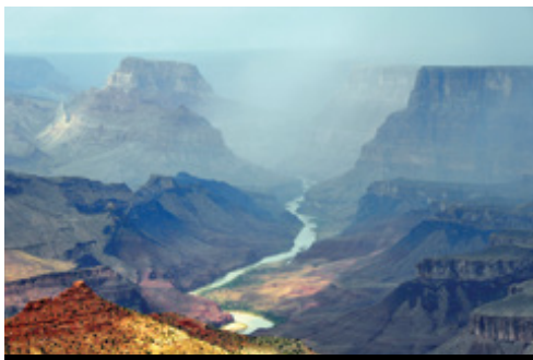
photo: Las Vegas — Gli hotel Parco Nazionale del Grand Canyon — Panorama