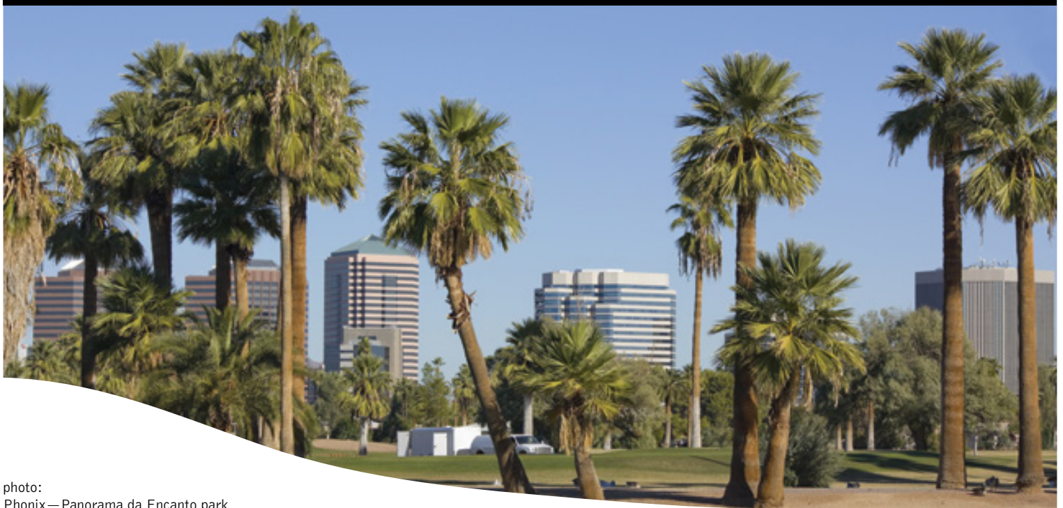
photo: Phonix—Panorama da Encanto park