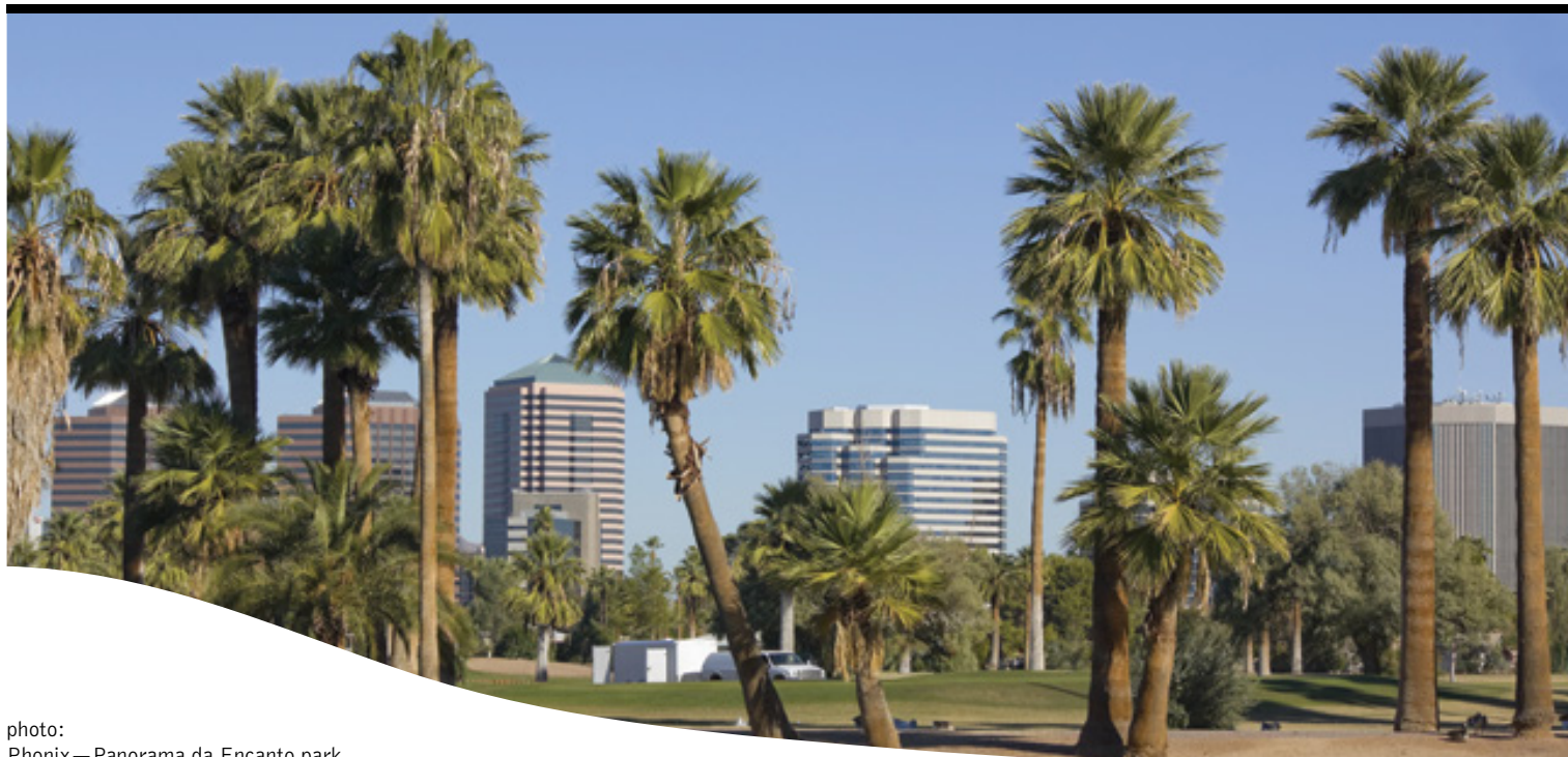
Panorama da Encanto park

10 giorni / 9 notti. Da giugno a settembre. Inizio/Fine tour: Las Vegas