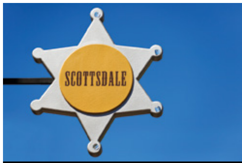
photo: Scottsdale, AZ Parco Nazionale del Grand Canyon, AZ—Panorama

Prima colazione (con supplemento). Fine del tour.