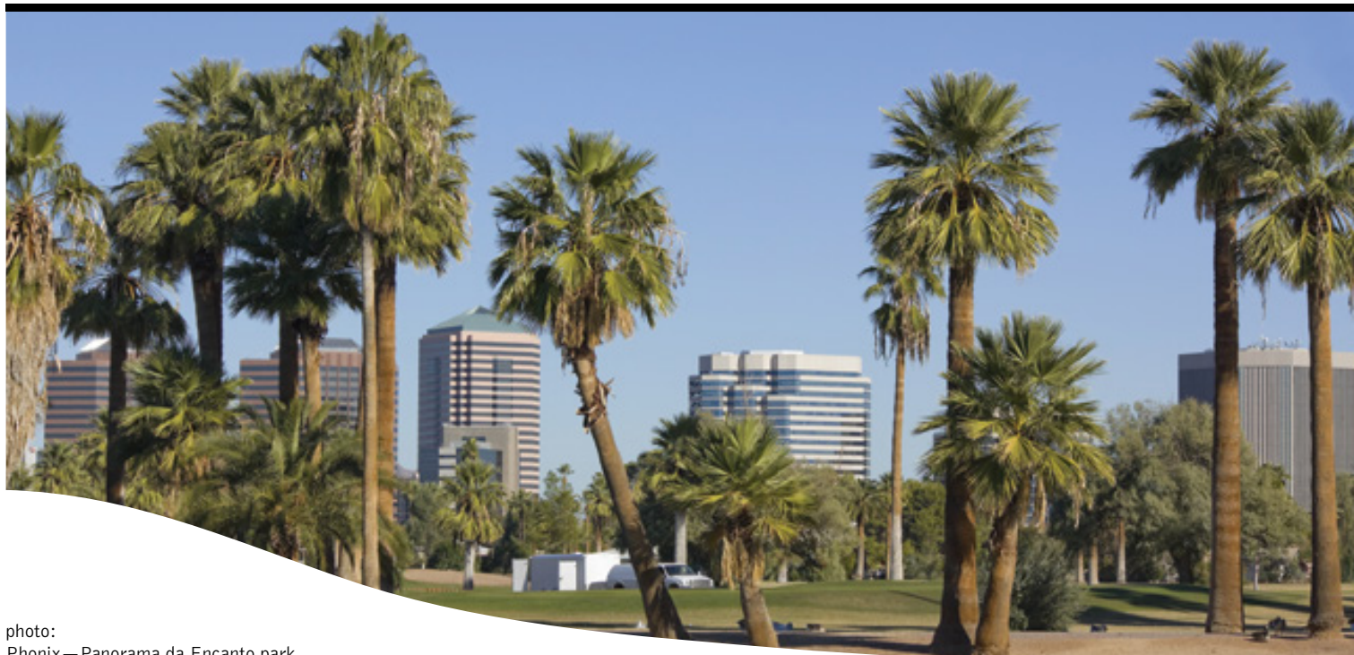
Panorama da Encanto park

19 giorni / 18 notti. Da giugno a settembre. Inizio/Fine tour: Los Angeles