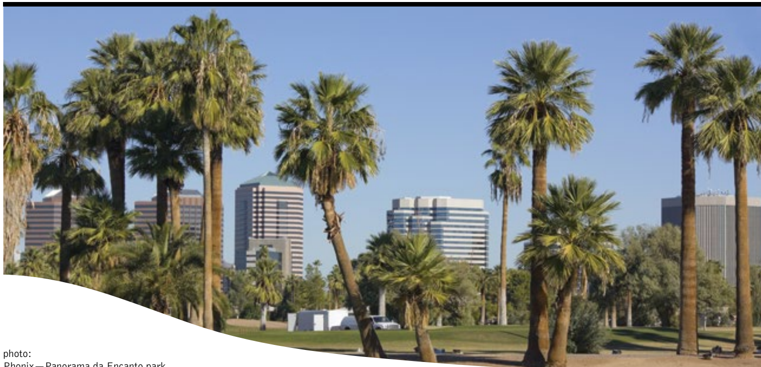
Panorama da Encanto park

19 giorni / 18 notti. Da maggio a settembre. Inizio/Fine tour: Los Angeles