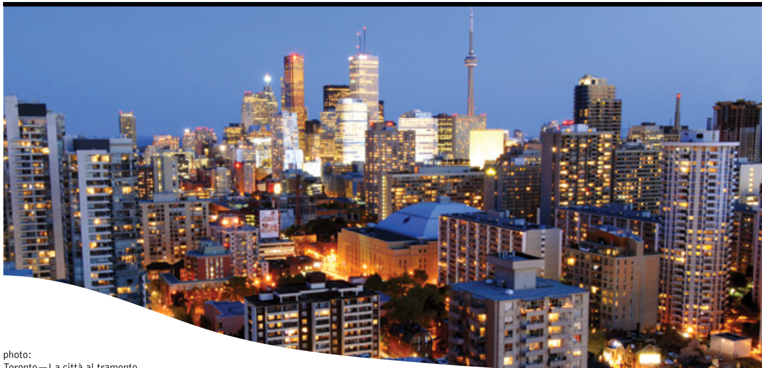
photo: Toronto — La città al tramonto

10 giorni / 9 notti. Da aprile a ottobre. Inizio/Fine tour: New York