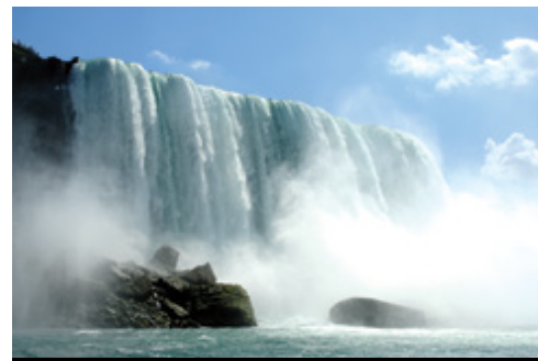
photo: Cascate del Niagara, NY