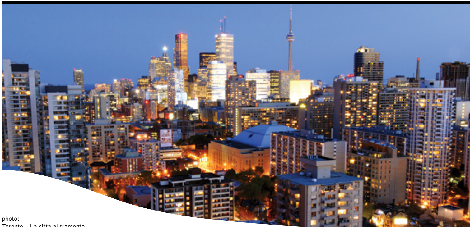
Toronto—La città al tramonto

10 giorni / 9 notti. Da aprile a ottobre. Inizio/Fine tour: New York