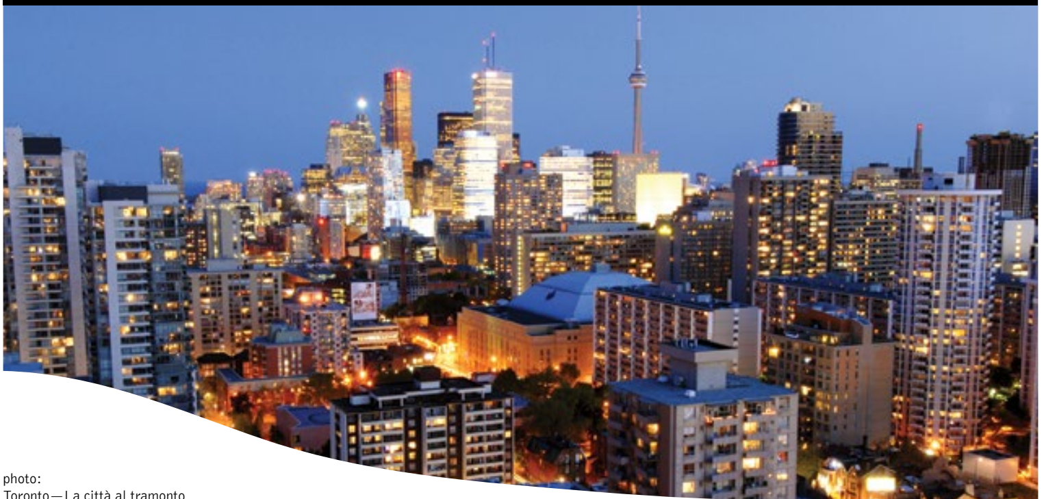
photo: Toronto—La città al tramonto

10 giorni / 9 notti. Da aprile a ottobre. Inizio/Fine tour: New York