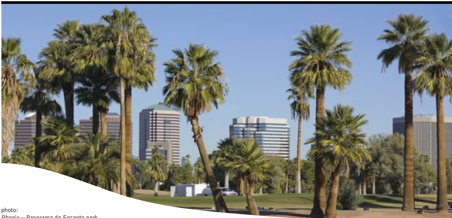
Panorama da Encanto park

19 giorni / 18 notti. Da maggio a settembre. Inizio/Fine tour: Los Angeles