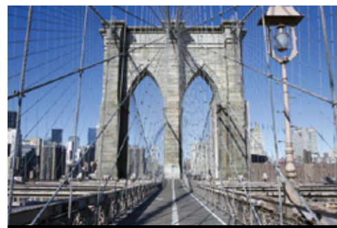
photo: Cascate del Niagara, NY New York, NY — Il ponte di Brooklin