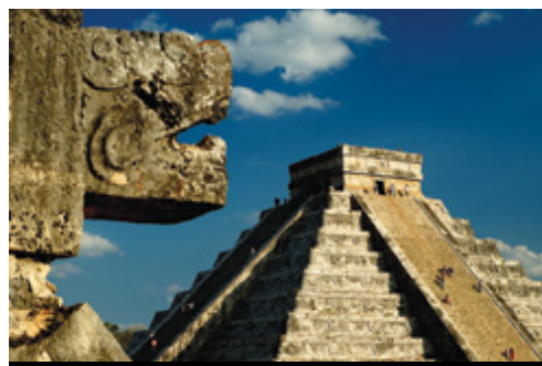
photo: Uxmal, YUC — Le rovine I piccantissimi peperoncini messicani Chichen Itza, YUC — Il sito archeologico