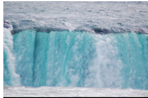
photo: Cascate del Niagara, NY