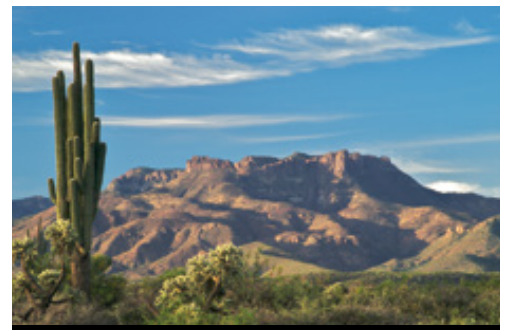
photo: Las Vegas—Panorama Un cactus Saguaro nel deserto dell'Arizona