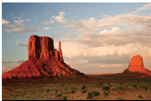
photo: Parco Nazionale del Grand Canyon—Panorama Parco Nazionale di Monument Valley