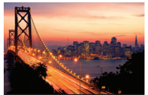
photo: Las Vegas—Le mille luci dei casinò San Francisco—Il Golden Gate Bridge