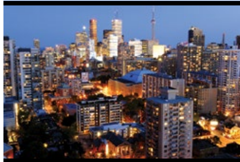
photo: Toronto—La città al tramonto