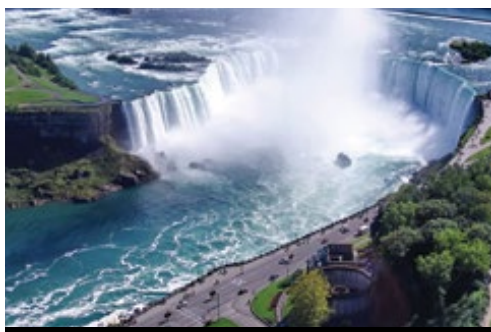
photo: Cascate del Niagara—Il versante americano e la Horseshoe Fall, Ontario, Canada