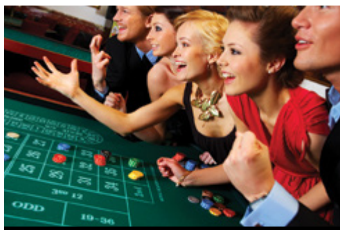
photo: San Francisco—Il Golden Gate Bridge Las Vegas—Il tavolo verde di un casinò