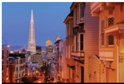
photo: San Francisco—via del Sacramento al tramonto San Francisco—Lombard Street

Prima colazione. Preparatevi a una festa per gli occhi: oggi è prevista la visita della Monument Valley, emblema del West americano. Mesa rossi e colline che si ergono dal deserto di sabbia sono fotografati innumerevoli, protagonisti silenziosi