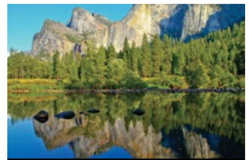
photo: Parco Nazionale dello Yosemite