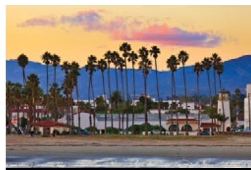
photo: Parco Nazionale del Bryce Canyon—Panorama Los Angeles—La spiaggia

di centinaia di film, pubblicità, volantini turistici. Il tour continua lungo il South Rim fino a Grand Canyon per la visita di Desert View, Mather Point, Yavapai e Bright Angel Lodge. Il Grand Canyon, la cui altezza sul livello del mare varia tra i 1500 e i 2700 metri, è una delle sette meraviglie naturali del mondo, i suoi incredibili paesaggi non potranno che stupirvi e ispirarvi. Si tratta di una ripida gola che il fiume Colorado ha scavato, giorno dopo giorno, facendosi strada nella roccia per più di 6000 anni.