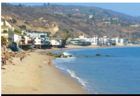
photo: Las Vegas—Panorama notturno Los Angeles—La spiaggia di Malibu

ammirare Spider Rock, la guglia di arenaria che si innalza dal canyon. Probabilmente la troverete familiare: è stata infatti la "protagonista" di una serie di spot televisivi. Il tour continua a Chinle. Cena.