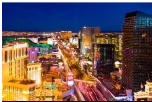
photo: Parco Nazionale del Grand Canyon—Panorama Las Vegas—Panorama notturno