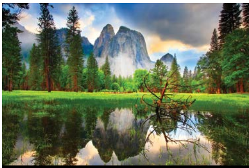
photo: Parco Nazionale dello Yosemite

[Escursione facoltativa] Golden Gate Bridge e Sausalito —Tour guidato attraverso il famosissimo ponte Golden Gate in direzione del villaggio di Sausalito. Il ritorno è previsto in traghetto attraverso la baia di San Francisco, che vi permetterà di ammirare da un'altra angolazione il ponte Golden Gate e la famosa prigione di Alcatraz.