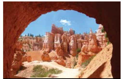
photo: Parco Nazionale di Monument Valley Parco Nazionale del Bryce Canyon