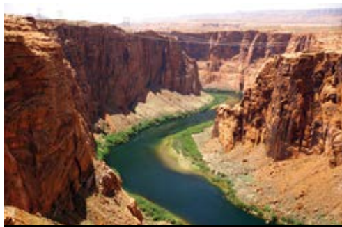
Parco Nazionale del Grand Canyon—Panorama