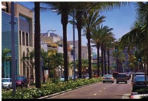
photo: Parco nazionale di Yosemite—Panorama Los Angeles—Rodeo Drive