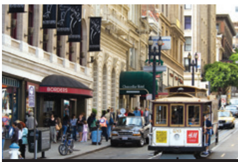
photo: Tornoto — La skyline illuminata al tramonto San Francisco — Un caratteristico tram

in direzione di San Diego, rinomata per il clima gradevole durante tutto l'arco dell'anno. All'arrivo un giro della città con pranzo. Pomeriggio libero per esplorare questa bellissima città.