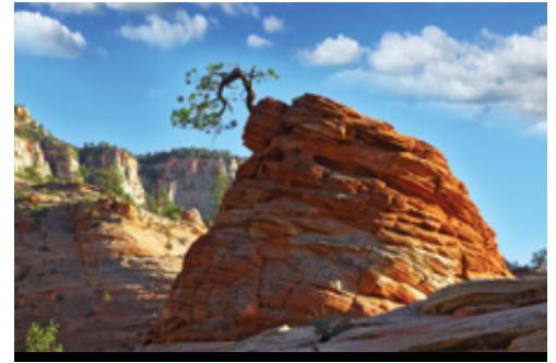
photo: Parco Nazionale del Grand Canyon

tardo pomeriggio. Pernottamento in albergo.