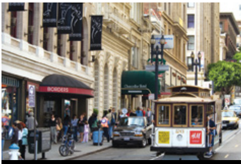
La skyline illuminata al tramonto San Francisco — Un caratteristico tram

rinomata per il suo clima gradevole durante tutto l'arco dell'anno. All'arrivo un giro della città con pranzo. Pomeriggio libero per esplorare questa bellissima città.