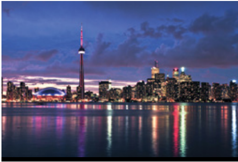
Toronto—La skyline illuminata al tramonto San Francisco—Un caratteristico tram