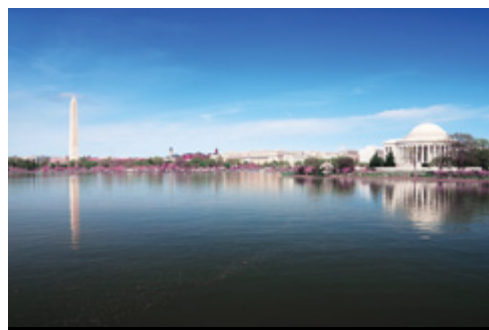
photo: New York—Panorama dei grattacieli Washington—Il Jefferson Memorial