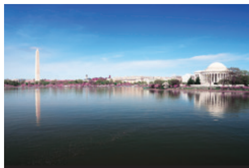
photo: New York — Panorama dei grattacieli Washington — Il Jefferson Memorial