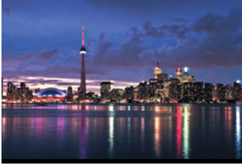
photo: Toronto—La skyline illuminata al tramonto San Francisco—Un caratteristico tram

per imbarcarvi sul volo per New York. Arrivo e trasferimento all'Hotel Riu Plaza Times Square. Dopo aver effettuato il check in avrete a disposizione nella lobby il concierge Volatour (tutti i giorni dalle 8 alle 19) con personale italiano. Il vostro hotel si trova letteralmente nel cuore di NY! New York è una delle più vibranti e cosmopolite città del mondo, ogni suo angolo è ricco di gallerie, musei, teatri, ristoranti e negozi per un indimenticabile shopping!