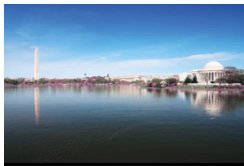
photo: New York—Panorama dei grattacieli Washington—Il Jefferson Memorial