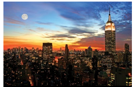
photo: Boston—Le tipiche architetture della città New York—Panorama al tramonto