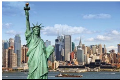
photo: Cascate del Niagara—La Horseshoe Fall New York—Il porto e, in primo piano, Lady Liberty