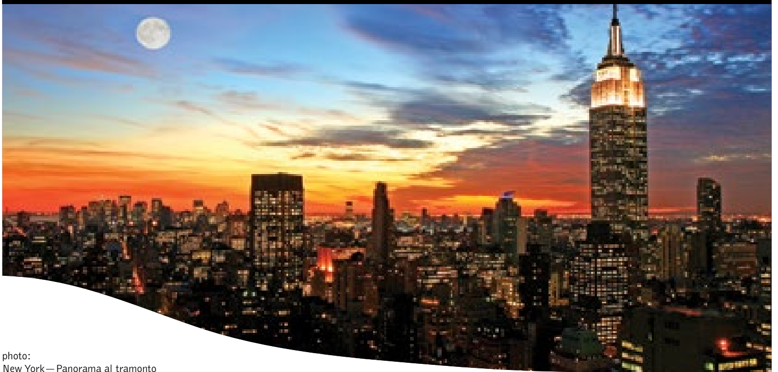
photo: New York—Panorama al tramonto

8 giorni / 6 notti. Da maggio a settembre. Inizio/Fine tour: New York, NY