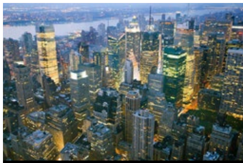
photo: Cascate del Niagara—Il versante americano New York—Panorama