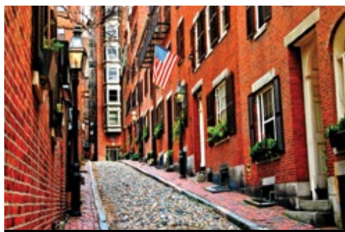
photo: Boston—Il Freedom Trail Boston—Il caratteristico quartiere di Beacon Hill