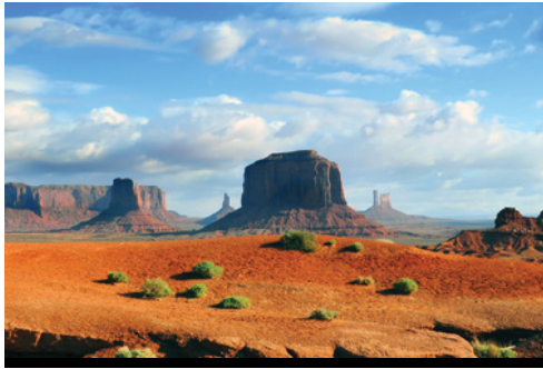
photo: Parco Nazionale di Monument Valley

La visita del Parco Nazionale di Arches, la più grande collezione al mondo di archi naturali. All'interno dei 76,518 acri del Parco sono conservati più di 2000 archi oltre a un'incredibile varietà di altre formazioni geologiche. Massicci, rocce, pinnacoli e guglie svettano maestosi sui visitatori intenti a esplorare il Parco dai più svariati punti di vista. Il più famoso degli archi è il Delicate Arch: per ammirarlo dovrete lasciare la strada principale e scendere per un sentiero. Durante la visita vi imbatteverete probabilmente in piccoli branchi di pecore bighorn, il cui colore del manto permette loro di mimetizzarsi col paesaggio. Al termine della visita proseguiamo per Moab, dove è previsto il pernottamento.