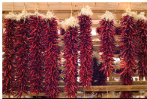
photo: Parco Nazionale di Mesa Verde Santa Fe—Trecce di peperoncini piccanti