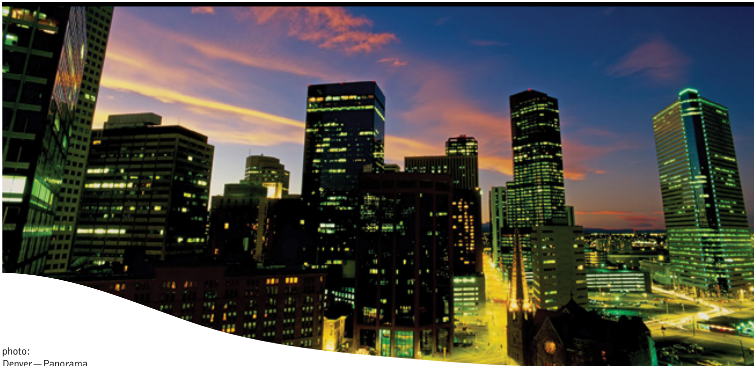
photo: Denver — Panorama

15 giorni / 14 notti. Da giugno a settembre. Inizio/Fine tour: Denver