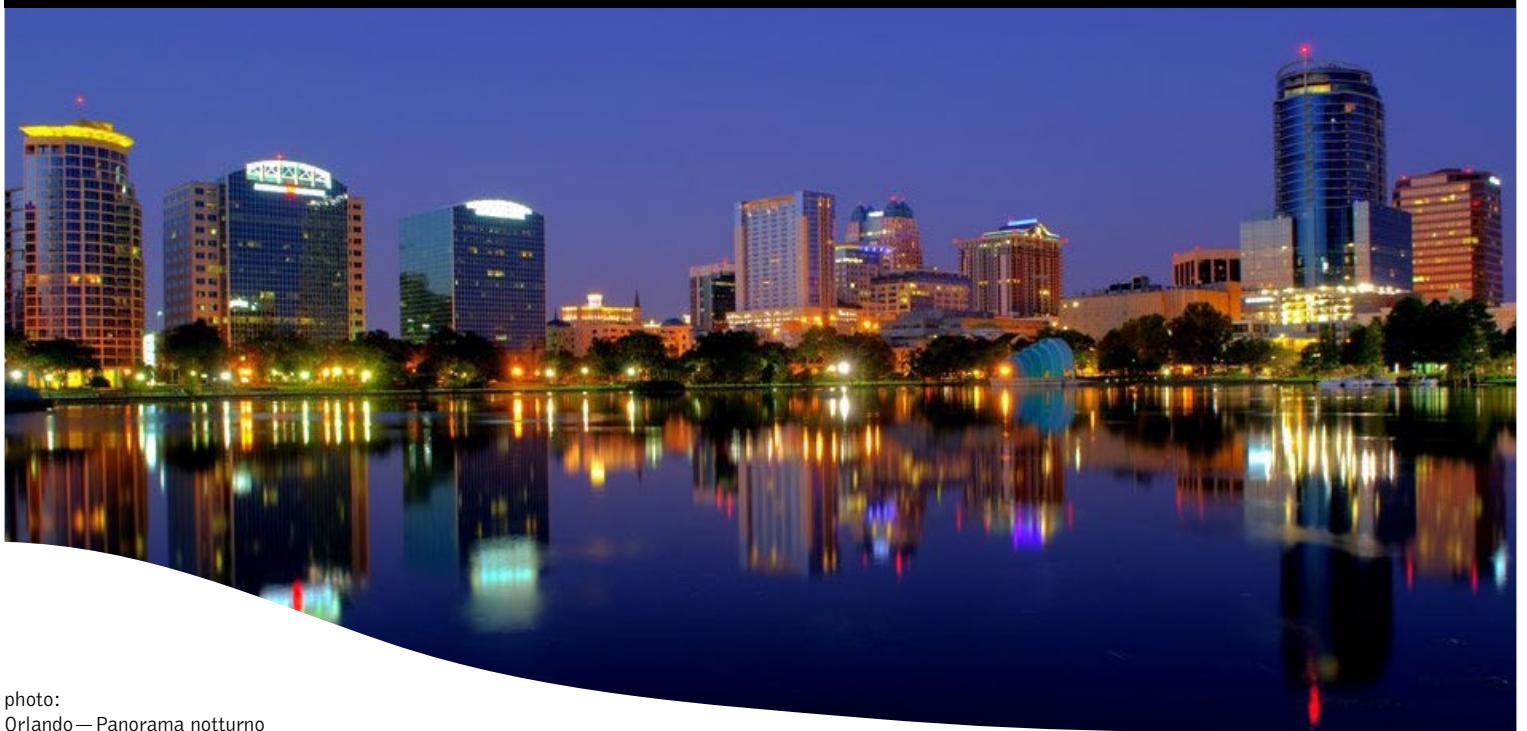
photo: Orlando—Panorama notturno

10 giorni / 9 notti. Da gennaio a settembre. Inizio/Fine tour: Miami