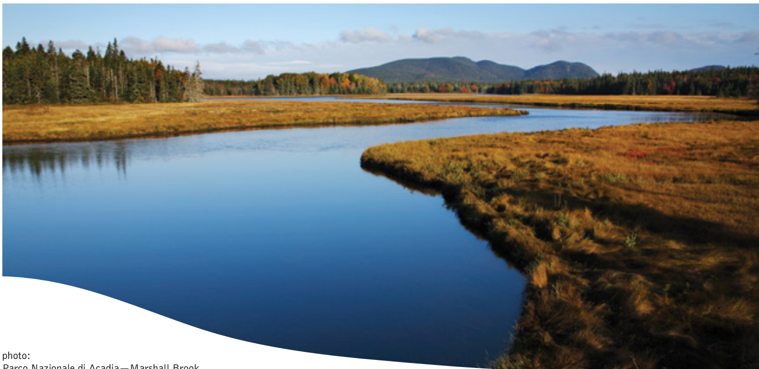
photo: Parco Nazionale di Acadia—Marshall Brook

9 giorni / 8 notti. Da giugno a settembre. Inizio/Fine tour: Boston