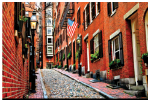
photo: Boston—Il Freedom Trail Boston—Il caratteristico quartiere di Beacon Hill