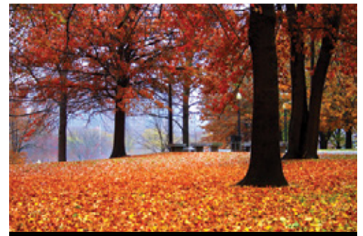
photo: Boston—Le tipiche architetture della città Boston, MA—Il Boston Common in autunno

delle penali di cancellazione del viaggio da parte del cliente. L'assicurazione annullamento Base legittima l'assicurato a chiedere il rimborso per i motivi riportati all'art.1 della normativa anch'essa allegata. L'assicurazione annullamento All Risk legittima l'assicurato a chiedere il rimborso per qualsiasi motivo documentabile (come ad esempio anche la semplice malattia di un animale domestico). Entrambe le polizze vanno richieste contestualmente alla conferma del viaggio e le relative normative possono essere visionate e/o scaricate accedendo al link presente in alto su tutte le pagine web del nostro sito e denominato "Assicurazione". Tutti gli altri supplementi facoltativi quali assicurazioni mediche integrative, escursioni, ecc. al contrario possono essere integrati anche successivamente alla conferma del viaggio, senza limiti temporali di inserimento.