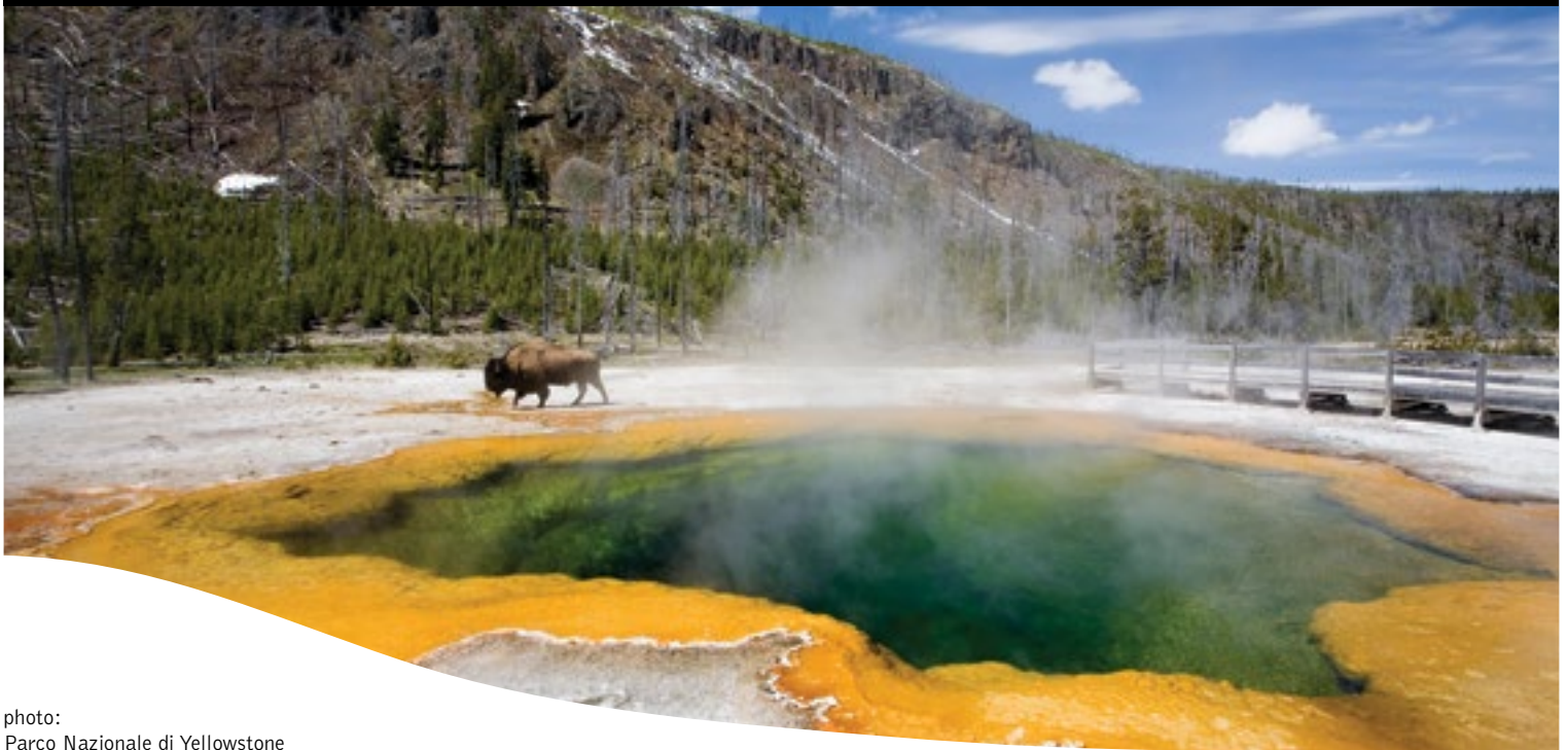
photo: Parco Nazionale di Yellowstone

15 giorni/14 notti. Da giugno ad agosto. Inizio/Fine tour: Denver