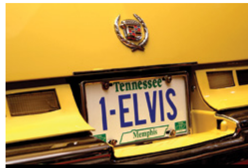
photo: New York—Central Park in autunno Memphis—La targa di una Cadillac