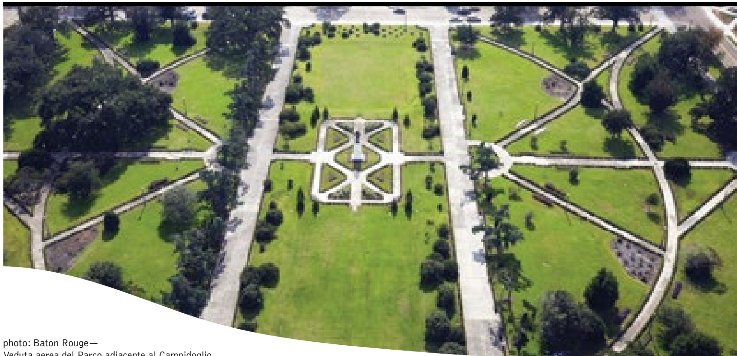
photo: Baton Rouge— Veduta aerea del Parco adiacente al Campidoglio

12 giorni / 11 notti. Da giugno a settembre. Inizio/Fine tour: New York/New Orleans