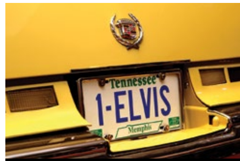
photo: New York—Central Park in autunno Memphis—La targa di una Cadillac