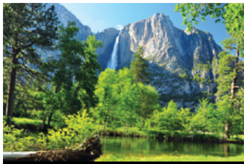
Parco Nazionale del Bryce Canyon—Panorama Parco Nazionale di Yosemite—Panorama