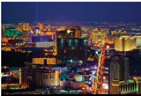
photo: Parco Nazionale del Gran Canyon—Panorama Las Vegas—Panorama