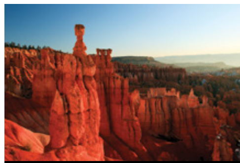
photo: Las Vegas— Panorama Parco Nazionale del Bryce Canyon— Panorama

la più grande collezione al mondo di archi naturali. All'interno dei 76,518 acri del Parco sono conservati più di 2000 archi oltre a un'incredibile varietà di altre formazioni geologiche. Massicci, rocce, pinnacoli e guglie sveltano maestosi sui visitatori intenti a esplorare il Parco dai più svariati punti di vista. Il più famoso degli archi è il Delicate Arch: per ammirarlo dovrete lasciare la strada principale e scendere per un sentiero. Durante la visita vi imatterete probabilmente in piccoli branchi di pecore bighorn, il cui colore del manto permette loro di mimetizzarsi col paesaggio. Al termine della visita proseguiamo per Moab, dove è previsto il pernottamento.