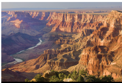
photo: Parco Nazionale di Monument Valley Parco Nazionale del Grand Canyon—Panorama