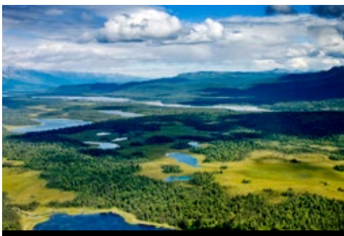
photo: Anchorage—Panorama al tramonto Denali National Park—Panorama