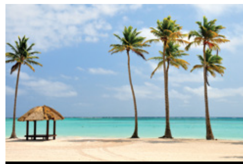
photo: Punta Cana — Relax nelle magnifiche spiagge di sabbia dorata