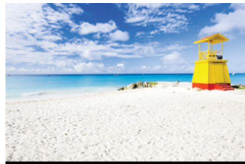
photo: Barbados—Baia Bottom Barbados—La Spiaggia e il Mar dei Caraibi