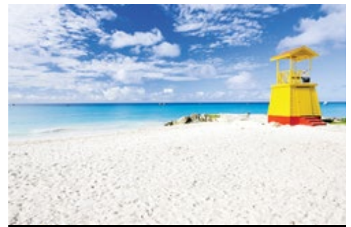
photo: Barbados—Baia Bottom Barbados—La Spiaggia e il Mar dei Caraibi