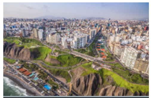
photo: Machu Picchu— Panorama La città di Miraflores Town e, sullo sfondo, Lima