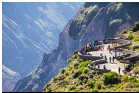
photo: Cruz del Condor Viewpoint

Tariffe aeree nazionali / internazionali; Quota d'iscrizione e assicurazione medico / bagaglio € 60; Assicurazione annullamento facoltativa Base 3,5%; Assicurazione annullamento facoltativa All Risk 6%; I pasti, le bevande, gli extra in genere, le mance e tutto quanto non espressamente indicato nel programma; Spese personali come lavanderia, telefonate, escursioni facoltative.