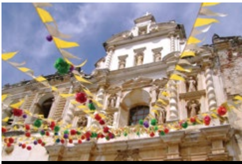
photo: Città del Guatemala—Il rinomato caffè Antigua—La Chiesa di San Francisco

7° giorno: Livingston—Flores (domenica—210 km) Escursione in barca lungo il Rio Dulce, circondati dalla lussureggiante vegetazione tropicale di questo angolo del Guatemala. Pranzo in ristorante. Nel pomeriggio 3 ore di strada a Flores. Arrivo e sistemazione in hotel.