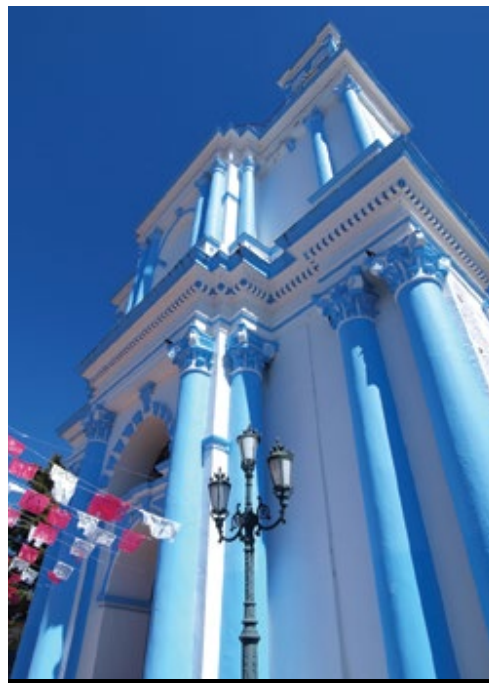
photo: San Cristobal de las Casas Tulum—Le rovine e il Mar dei Caraibi