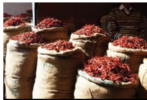
photo: Chichen Itza, YUC—Il sito archeologico I piccantissimi peperoncini messicani