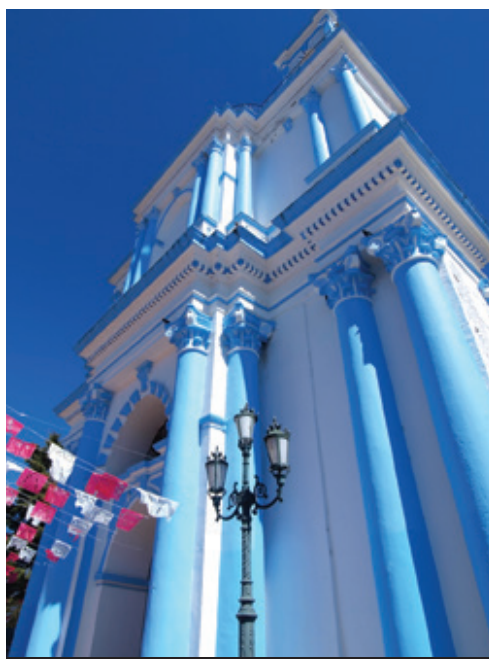
photo: San Cristobal de las Casas Tulum—Le rovine e il Mar dei Caraibi