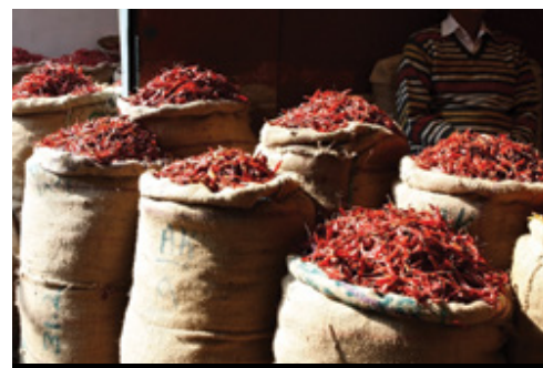
photo: Chichen Itza, YUC—Il sito archeologico I piccantissimi peperoncini messicani