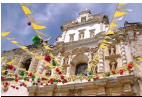
photo: Città del Guatemala—Il rinomato caffè Antigua—La Chiesa di San Francisco