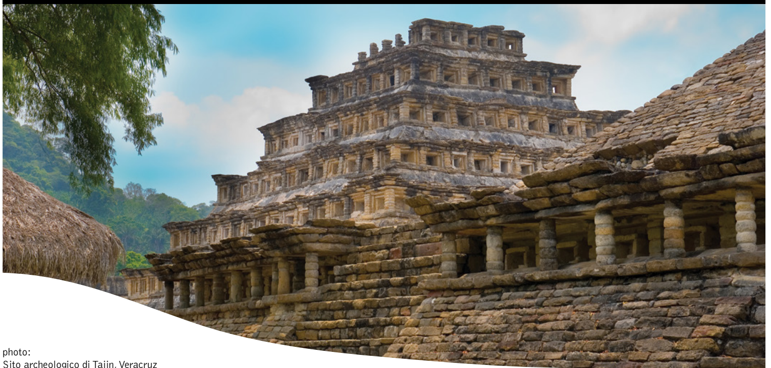
photo: Sito archeologico di Tajin, Veracruz

14 giorni / 13 notti. Da gennaio a novembre. Inizio/Fine tour: Città del Messico/Riviera Maya