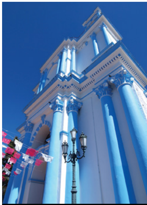
photo: San Cristobal de las Casas

(nb: gli alberghi possono essere quelli indicati o altri di tipologia equivalente)