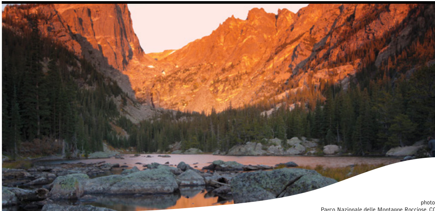
photo: Parco Nazionale delle Montagne Rocciose, CO

18 giorni / 17 notti. Tutto l'anno. Inizio/Fine tour: Las Vegas, NV