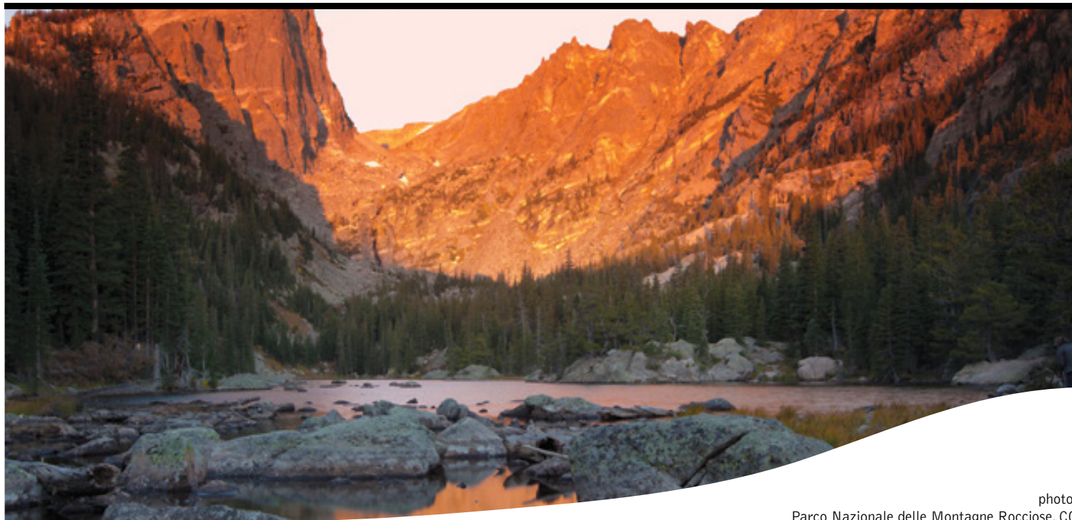
photo: Parco Nazionale delle Montagne Rocciose, CO

18 giorni / 17 notti. Tutto l'anno. Inizio/Fine tour: Las Vegas, NV