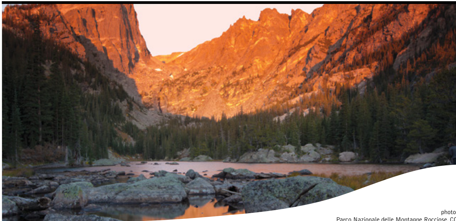
photo: Parco Nazionale delle Montagne Rocciose, CO

18 giorni / 17 notti. Tutto l'anno. Inizio/Fine tour: Las Vegas, NV