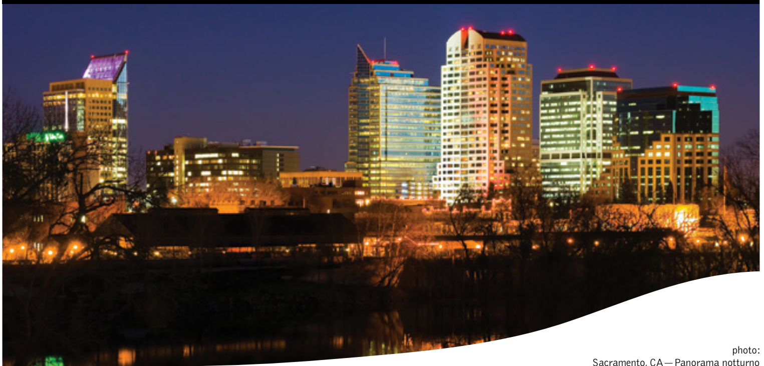
photo: Sacramento, CA—Panorama notturno

17 giorni / 16 notti. Tutto l'anno. Inizio/Fine tour: Los Angeles, CA