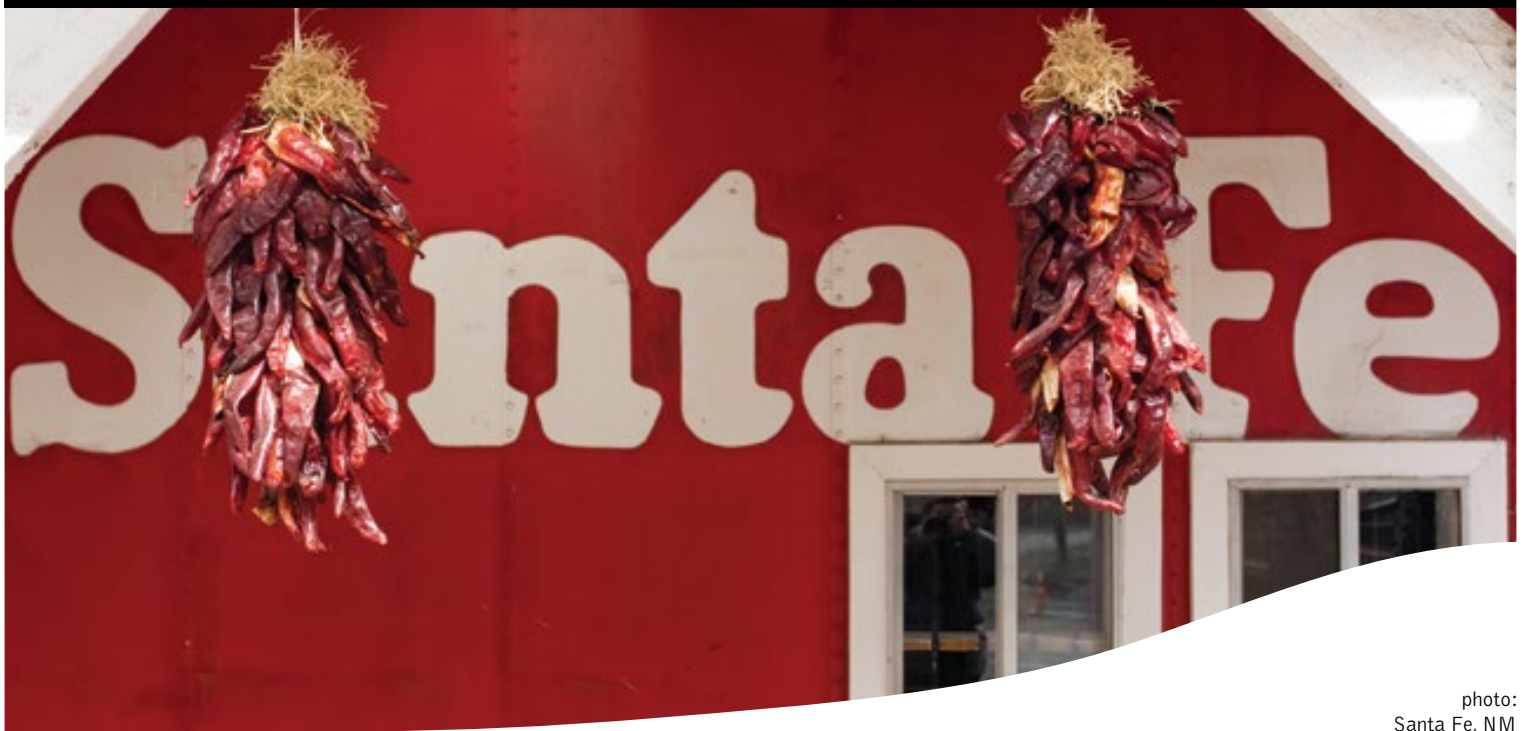
photo: Santa Fe, NM

14 giorni / 13 notti. Tutto l'anno. Inizio/Fine tour: San Francisco/Los Angeles, CA