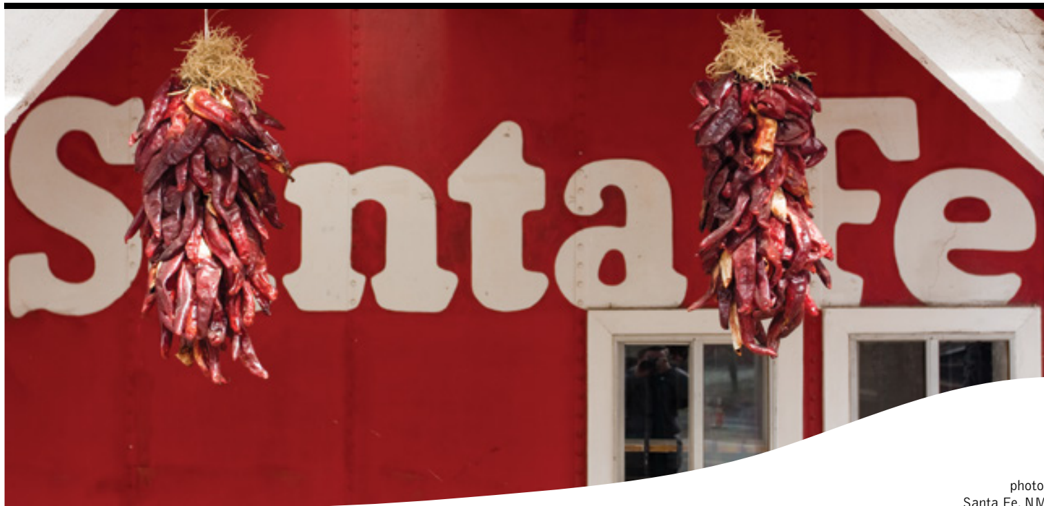
photo: Santa Fe, NM

14 giorni / 13 notti. Tutto l'anno. Inizio/Fine tour: San Francisco/Los Angeles, CA