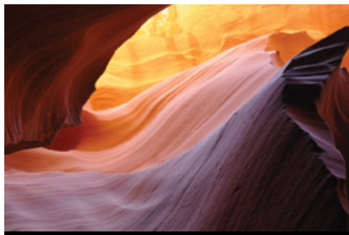
photo: Parco Nazionale di Zion, UT—Panorama Parco Nazionale del Grand Canyon, AZ—Le rocce