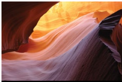
photo: Parco Nazionale di Zion, UT—Panorama Parco Nazionale del Grand Canyon, AZ—Le rocce