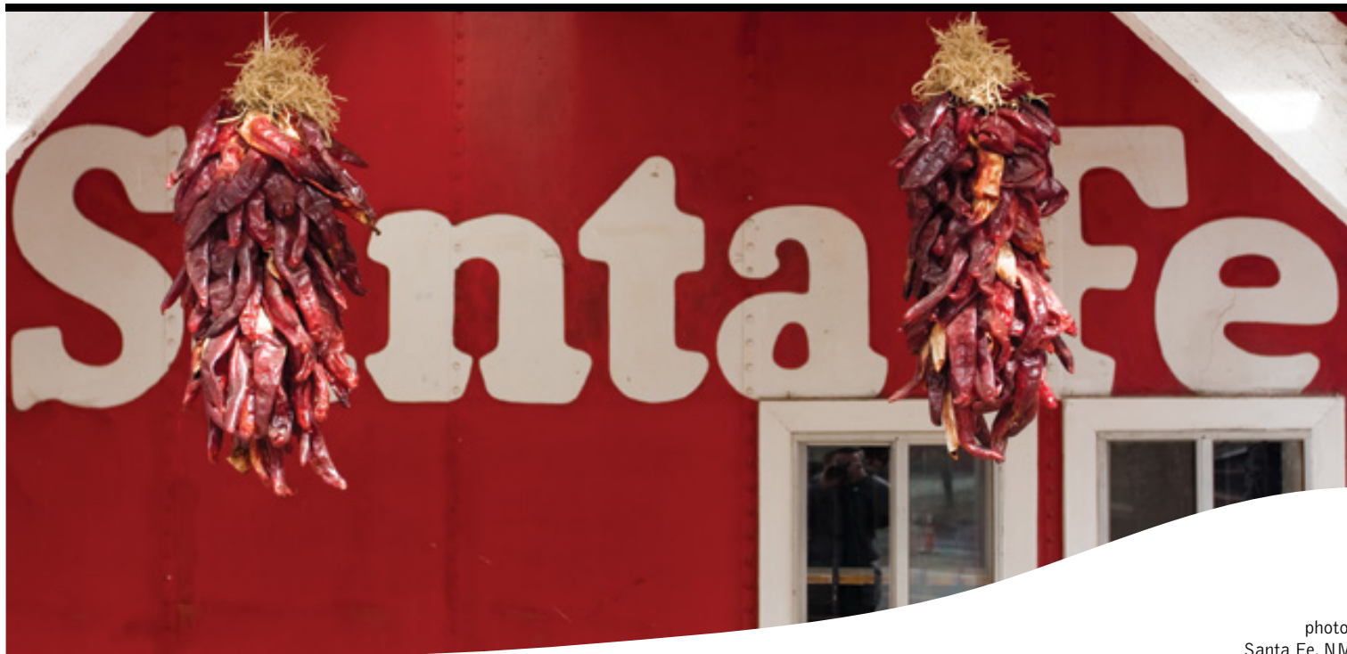
photo: Santa Fe, NM

14 giorni / 13 notti. Tutto l'anno. Inizio/Fine tour: San Francisco/Los Angeles, CA