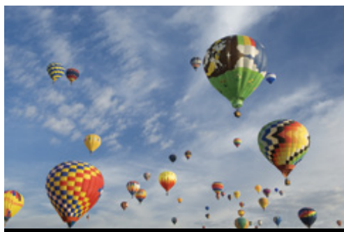
photo: Diga di Glen Canyon, UT—Panorama Albuquerque, NM—Balloon Fiesta International