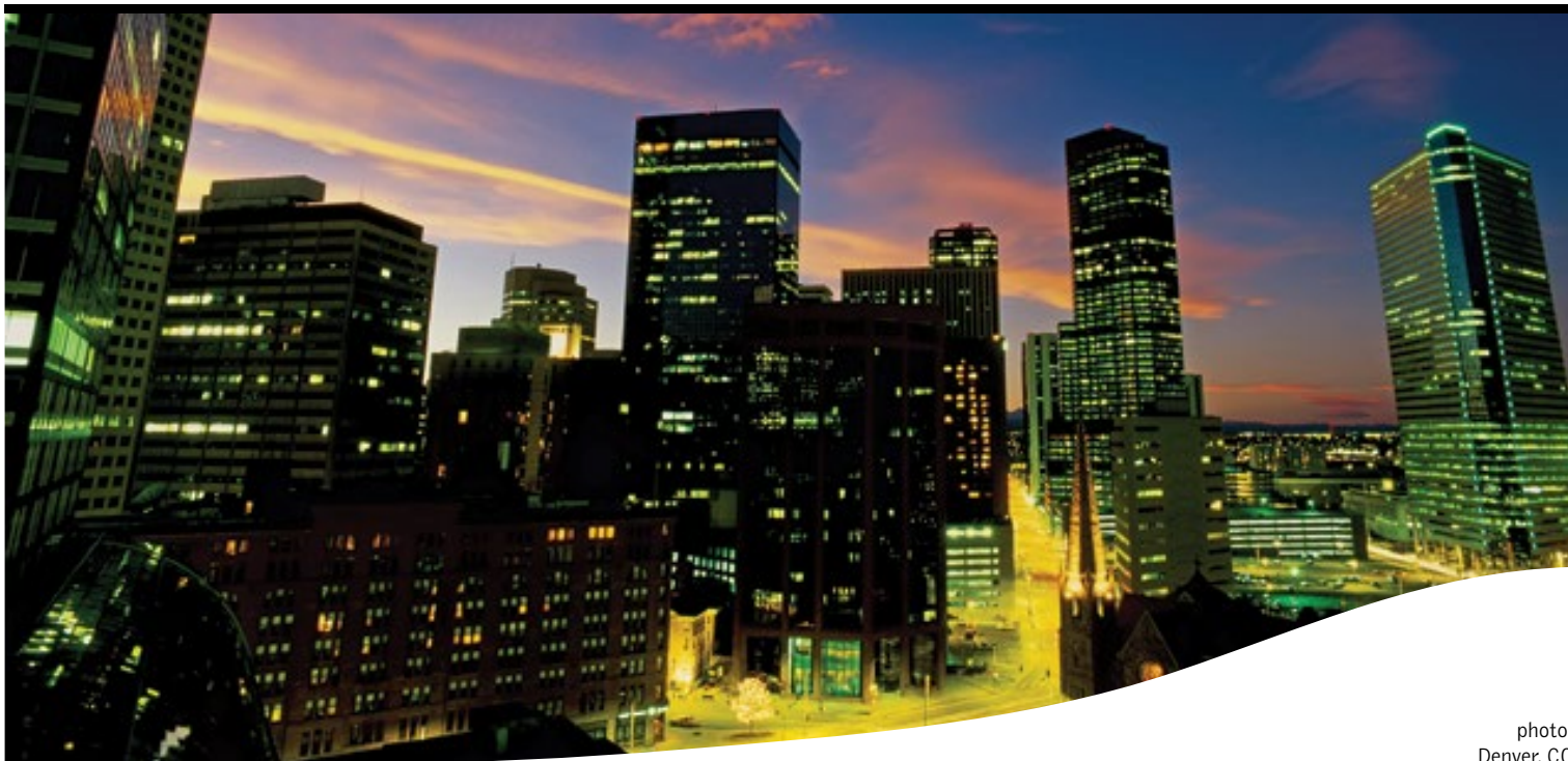
photo: Denver, CO

15 giorni / 14 notti. Da maggio a ottobre. Inizio/Fine tour: Los Angeles, CA