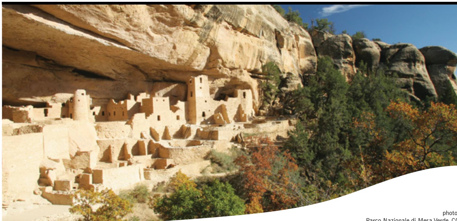
photo: Parco Nazionale di Mesa Verde, CO

20 giorni / 19 notti. Da maggio a ottobre. Inizio/Fine tour: San Francisco/Los Angeles, CA