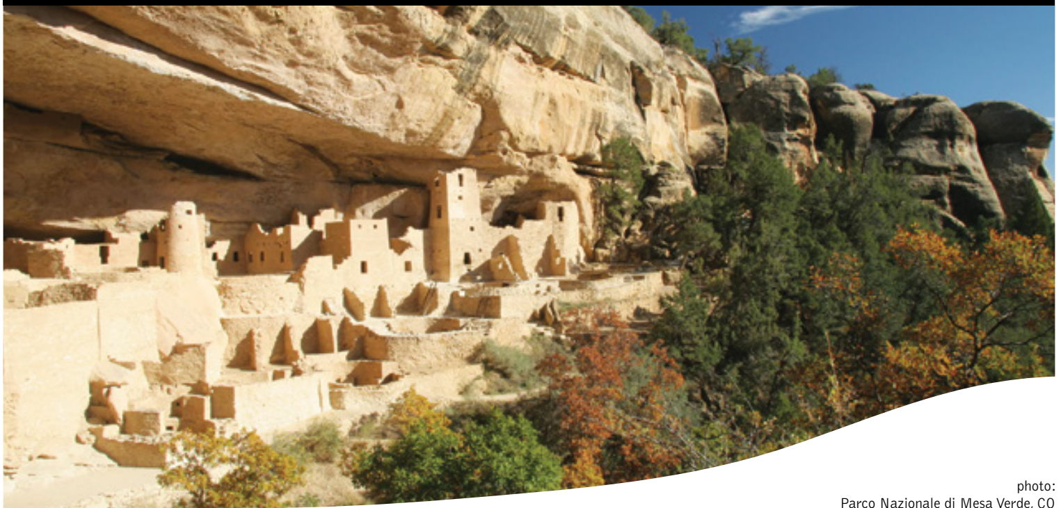
photo: Parco Nazionale di Mesa Verde, CO

20 giorni / 19 notti. Da maggio a ottobre. Inizio/Fine tour: San Francisco/Los Angeles, CA