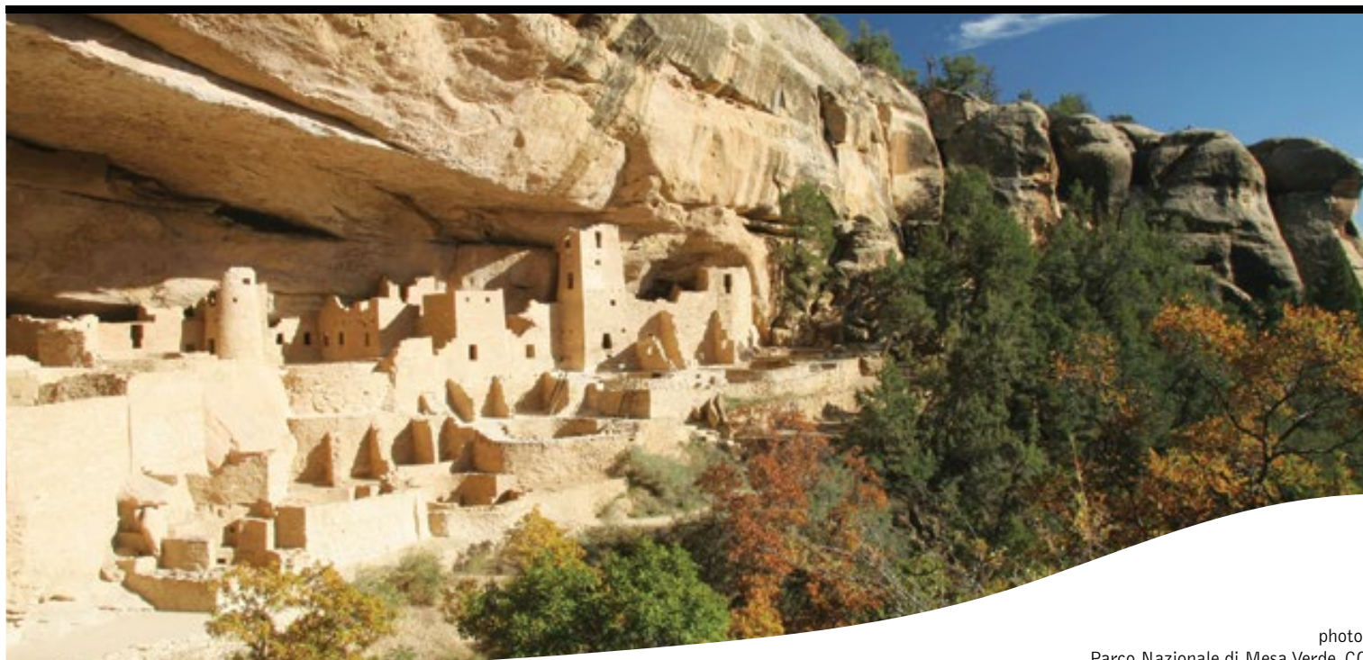
photo: Parco Nazionale di Mesa Verde, CO

20 giorni / 19 notti. Da maggio a ottobre. Inizio/Fine tour: San Francisco/Los Angeles, CA