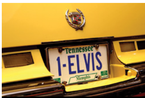
photo: St. Augustine, FL—La celebre fontana Memphis, TN—La targa di una Cadillac